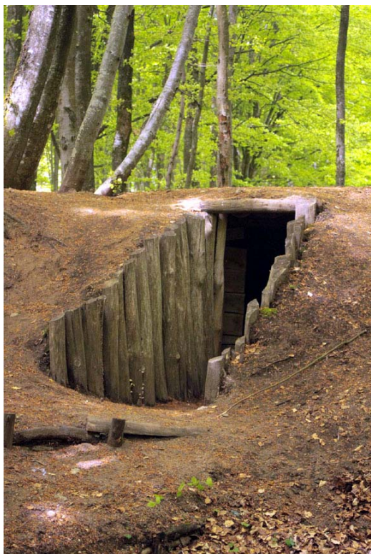
Wejście do bunkra

Lasy Mirachowskie, ozdobione m.in. piękną Rynną Potęgowską, oglądaną zwłaszcza z Lechickiej Szczeliny, tajemniczym Lubygościem czy też niezwykłą Mirachowską Świtezia – Jeziorem Kamiennym, oraz Jeziora Raduńskie, czyli centralną część Wysoczyzny Pojezierza Kaszubskiego, okolice Kościerzyny, a także rejon jezior wdzydzkich.