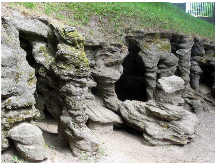
Wejście do jaskini

Istnieje także 30-kilometrowej długości Szlak Grot Mechowskich (kolor czarny) prowadzący z Pucka do Krokowej – w początkowej części prowadzi on przez podpuckie stare wsie i folwarki, a potem północną połącią Puszczy Darżlubskiej. Oczywiście szlak wziął swą nazwę od największej atrakcji szlaku, najslawniejszej osobliwości całej okolicy – jaskini w Mechowie. Mechowo to także urokliwy kościółek ryglowy. Poza tym na dalszej trasie szlaku dwa głązy narzutowe, malownicze Jezioro Dobre oraz na jej końcu gminna Krokowa z wywodzącym się z okresu gotyku, odrestaurowanym zamczkiem Krokowskich.