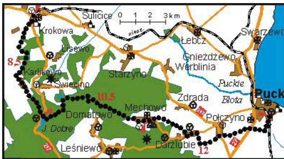
Szlak Grot Mechowskich ( http://www.pomorskie.pttk.pl )

K aszubska wieś Mechowo, oddalona o 9 km na zachód od Pucka, położona jest w obszarze Puszczy Darżlubskiej, w dolinie niewielkiego potoku rozcinającego krawędź Kępy Starzyńskiej odprowadzającego swe wody ku rzece Płutnicy płynącej szeroką pradoliną. Dolina wspomnianego potoku wcięła się dość głęboko w podatny na erozję luźny materiał plejstoceni i tworzy strome stoki wysokości od 10 do 30 m. U podstawy